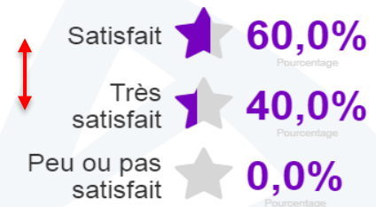
Les informations transmises (Documentation, réunion)