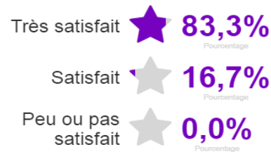
Suivi au cours de la formation