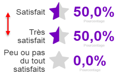
Prise en compte de votre demande