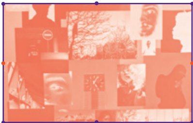
Exposition « E-Motion board »