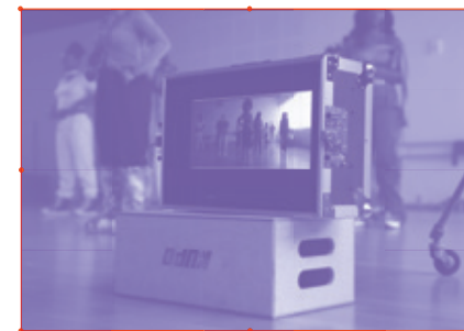
Tournage du court-métrage Endolor .