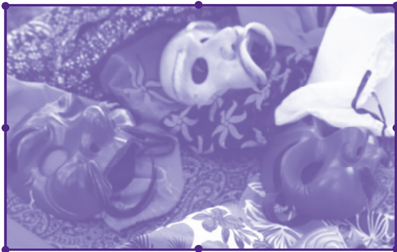
Costumes de la Fête de l'École des Arts